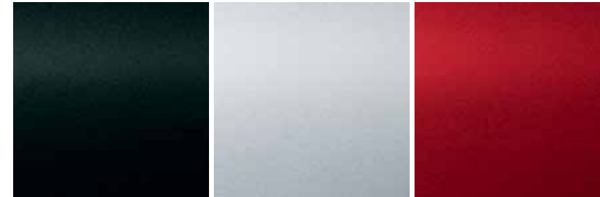
MARS GREY رمادي مزيجي WHITE PEARL أبيض لؤلؤي ORIENTAL RED احمر مشرق

أبيض جامد وأحمر مشرق: طبقة طلاء غير لامعة ألوان أخرى = طلاء معدني Solid white and oriental red: Opaque clearcoat Other colours = Metallic paint