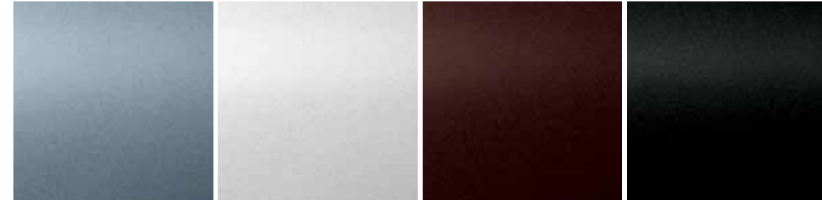
ULTRA SILVER فضي مترف SOLID WHITE أبيض جامد EBONY BROWN بني داكن BLACK METALLIC أسود معدني